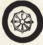
La roue de la Loi

La roue avec ses rayons bien emboîtés entre le moyeu et la jante représente en Inde l'ordre socio-religieux (dharma). On dit du Bouddha qu'il a fait tourner la roue d'une loi qui permet enfin d'accéder à la plus haute libération. Pour y parvenir, il y a huit grands moyens symbolisés par les huit rayons de la roue : la compréhension juste, la pensée juste, la parole juste, l'action juste, les moyens d'existence justes, l'effort juste, l'attention juste et la concentration juste.