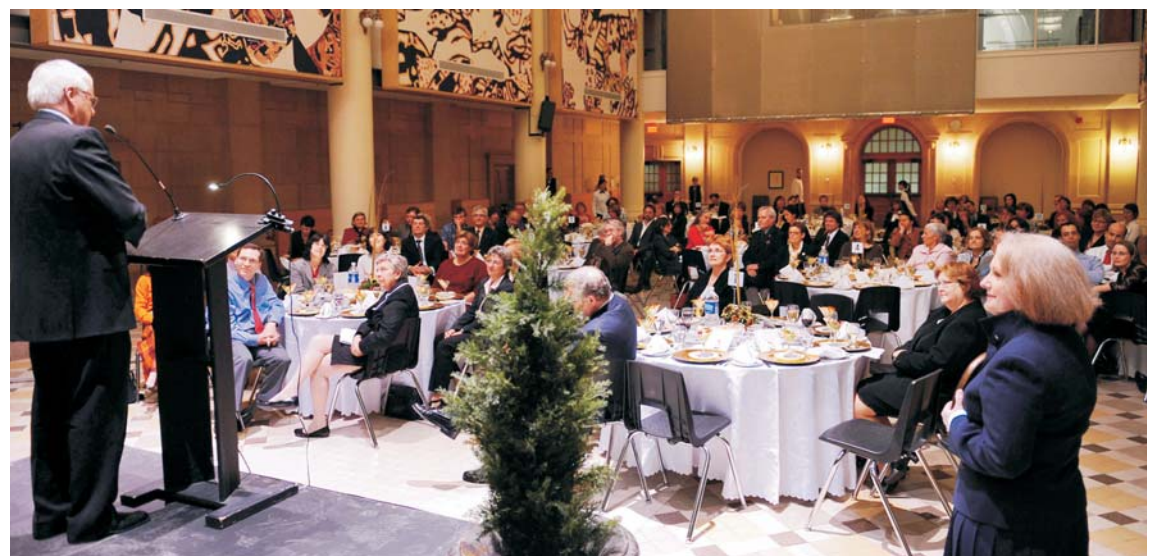
La cérémonie a eu lieu dans l'ancienne chapelle du Collège Jean-de-Brébeuf