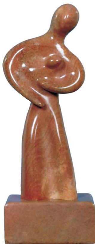
Oeuvre de Eugène Jankowski