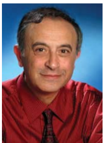
Prix de carrière scientifique Dr Emile Levy

Chaque année, la Fondation des étoiles souligne la contribution de chercheurs émérites ou qui débute une carrière scientifique dans le domaine de la recherche pédiatrique. Voici donc les lauréats de 2008 :