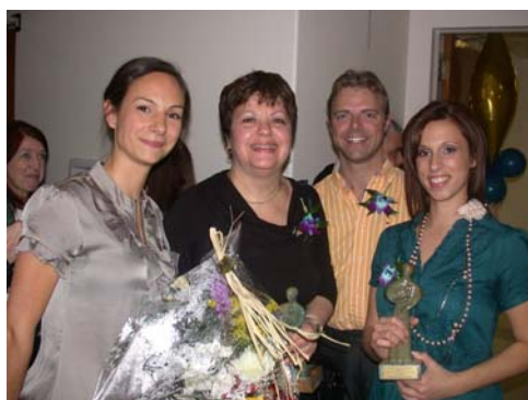
Lauréates du CII 2010-2011

Le Programme de reconnaissance de la DRH a pour but de reconnaître la contribution exceptionnelle d'individus ou de groupes de personnes au succès du CHU Sainte-Justine et à l'accomplissement de sa mission. Le Comité exécutif de chaque Conseil a le mandat de nommer les lauréats «carrière» et «relève». A l'aide d'une grille d'évaluation, chaque membre du CECII note sur 15 points chacune des candidatures basée sur les critères suivants : leadership (2), passion du travail (2), esprit d'équipe (2), qualité des soins infirmiers (2), engagement professionnel (2) , réalisations (2) et dossier général (3).