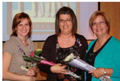
Récipiendaires des trois prix Leadership du Gala du CII

Jeudi 13 mai 2010 : Activités élaborés par le CRI pour remercier les collègues infirmières et faire la promotion du CRI : distribution de macarons du CRI sur toutes les unités et tous les quarts de travail.