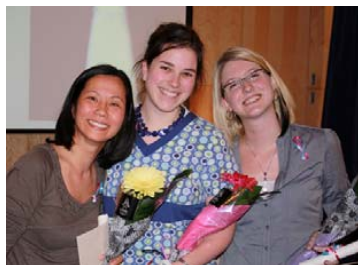
Récipiendaires des trois prix Curiosité scientifique du Gala du CII

Cette activité visait à reconnaître nos infirmières et infirmiers sous la forme d'un 5 à 7 et fut animé par M. Patrick Marsolais, animateur de radio et télévision. Les candidatures furent soumises les collègues de travail. Plus de 36 prix furent remis via les catégories suivantes : leadership; implication professionnelle; organisatrice sociale; promotion et adaptation aux changements; transfert des connaissances; super infirmière auxiliaire; curiosité scientifique; révélation de l'année; recrue de l'année; certificat « Dr Clown »; certificat « Jeannette »; certificat « Fred Pellerin ».