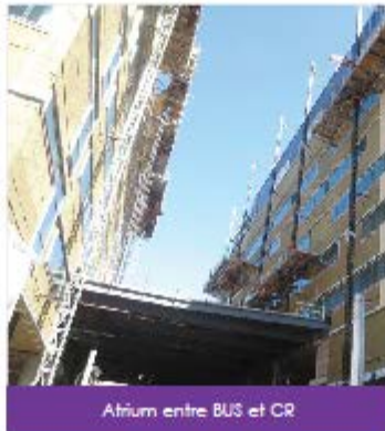
Atrium entre BUS et CR