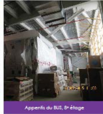
Appentis du BUS, 8 e étage