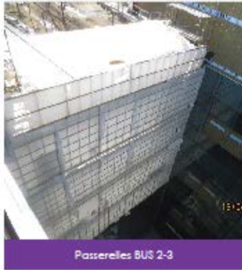
Passerelles BUS 2-3