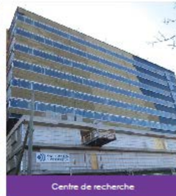
Centre de recherche