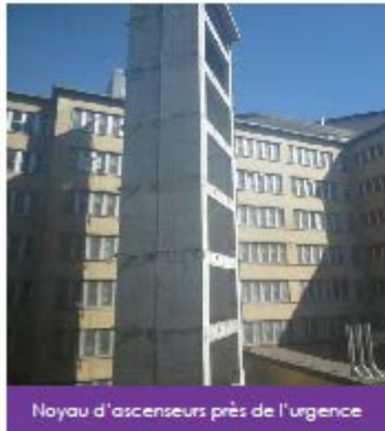
Noyau d'ascenseurs près de l'urgence