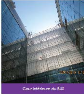
Cour intérieure du BUS