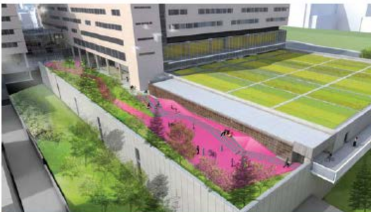
Esplanade nord et toit vert