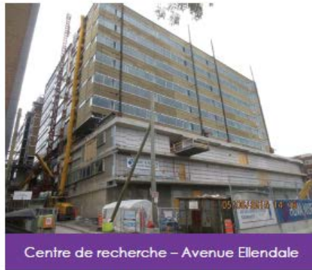
Centre de recherche – Avenue Ellendale