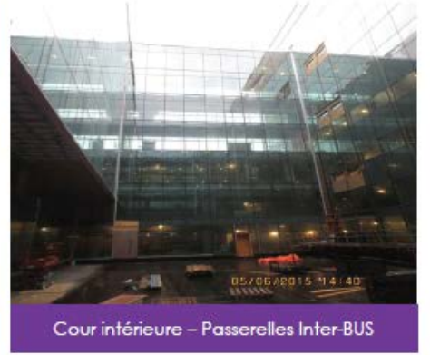
Cour intérieure – Passerelles Inter-BUS