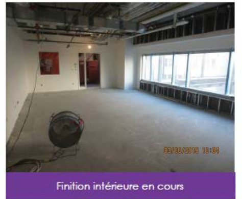
Finition intérieure en cours