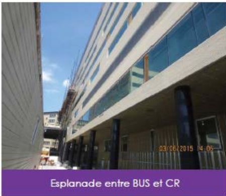
Esplanade entre BUS et CR