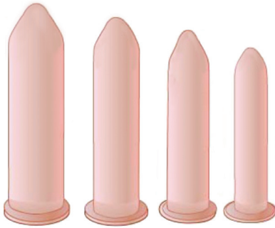
Dilatateurs en silicone

Un dilatateur est un objet en silicone ou en plastique, sans latex, en forme de cylindre, qui peut être de différentes grandeurs (en longueur et en largeur), selon tes besoins.